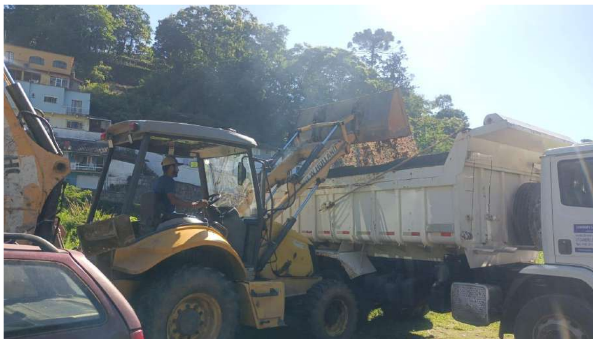
Corte da Barra