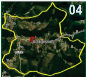
Albuquerque (partes), Canoas e Prata dos Aredes

Os esgotos serão coletados através do sistema Separador Absoluto e/ou Tempo seco (em locais onde não há a possibilidade técnica de instalação da primeira opção) e lançados na Estação de Tratamento de Efluentes Compacta e parte tratados por Biodigestor