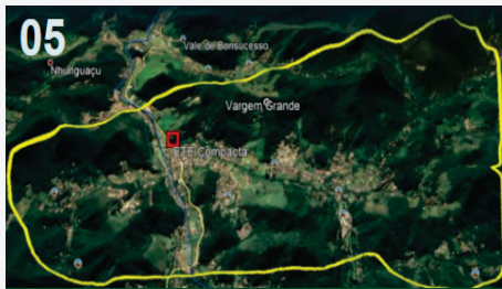
3º Distrito - Vargem Grande