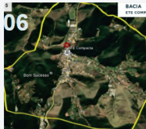
Quinta Lebrão, Fonte Santa, Albuquerque (partes), Prata e Fischer